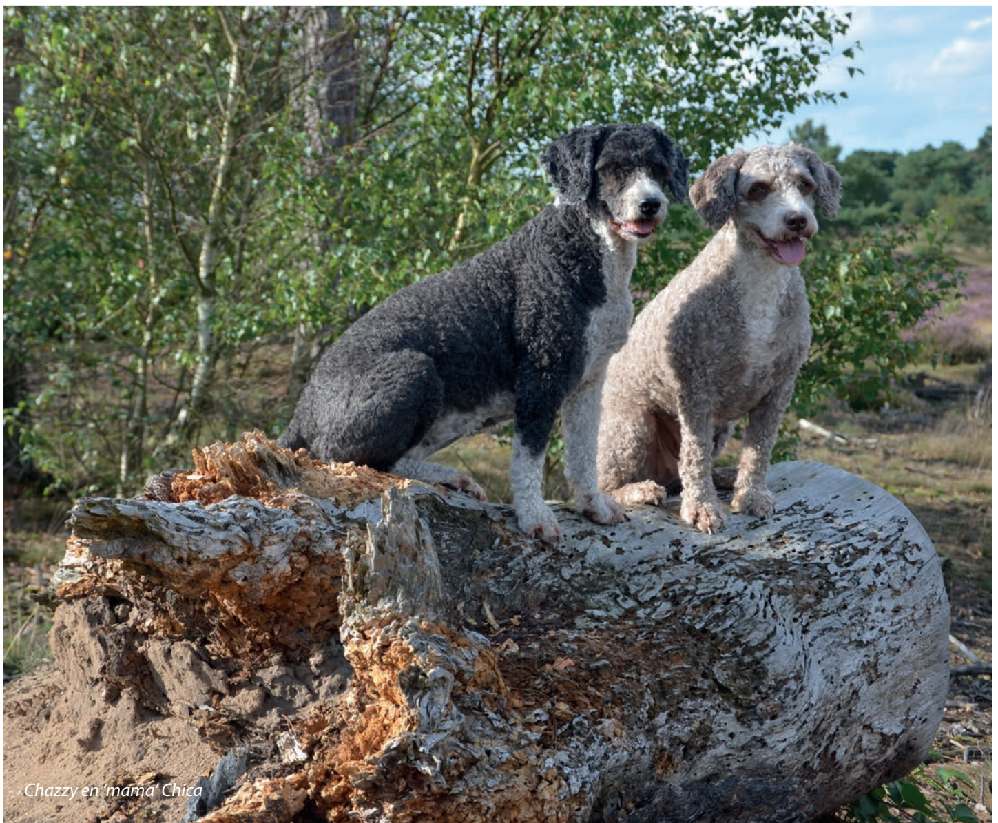
Chazzy en 'mama' Chica

In tegenstelling tot de SJP's hoef je een eenmaal behaald niveau niet steeds opnieuw te doen. Als je eenmaal grade 1 hebt behaald, kun je door naar grade 2 zonder de proeven van grade 1 weer te doen. Je kunt ook doortrainen en gelijk